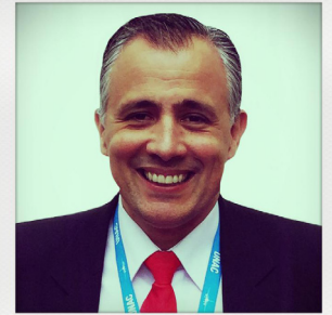
Francisco MORATA C/C basé PARIS ORY Qualifié CRJ