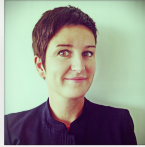
Marine TIFFAY C/C basée PARIS CDG Qualifiée Embraer