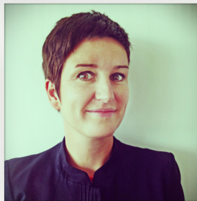
Marine TIFFAY C/C basée PARIS CDG Qualifiée Embraer