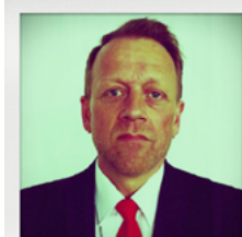
Robertus EPSWAMP C/C basée PARIS ORY Qualifié CRJ